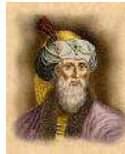
Flavius Josephus Géneral de Israel capturado por Vespasian En la Rebelión de 66-70, (EC)

En el párrafo del libro 2 (282) él escribe; “no hay ninguna ciudad de Grecios, ni bárbaros, ni ninguna nación cualquiera, aún nuestra aduna de basarse sobre el séptimo día no venido, y por cuál nuestro ayuno y encendiéndo de lámpara, y muchos de nuestras prohibiciones en cuanto a nuestra comida, no es observada.